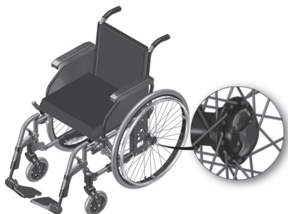
Figura 1.1-Botão de extração da roda traseira.