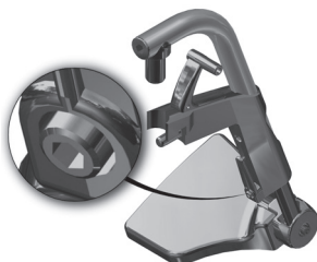
Figura 5.1-Localização do parafuso do pedal