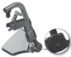
Figura 6.1-Localização do parafuso para regulagem do ângulo