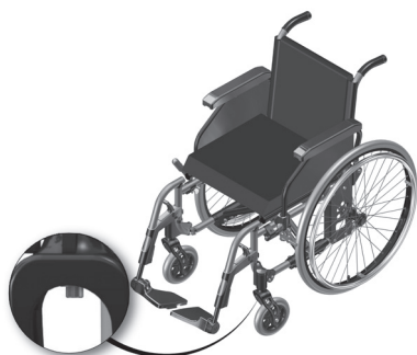
Figura 1.3-Localização do botão de extração do eixo dianteiro