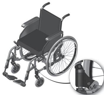
Figura 3.1- Detalhe da placa de fixação da roda dianteira

Para alterar o ângulo, abra os três parafusos da placa de fixação (figura 3.1), note que ela possui uma plaqueta com seis furos. Mova o conjunto dianteiro e encaixe a placa menor de acordo com que a roda fique na perpendicular em relação ao piso, torne a apertar os parafusos. Use duas chaves de boca número 10. Gire no sentido anti-horário para abrir.