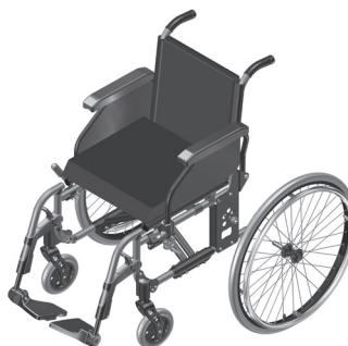
Figura 1.2-Roda traseira desencaixada