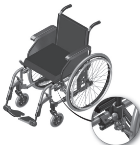
Figura 7.2- Indicação do parafuso de fixação do sistema de freio.