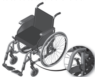
Figura 4.1-Alavanca do pedal