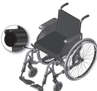
Figura 9.1- Localização da ponteira