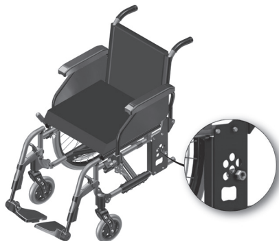
Figura 2.1- Indicação da bucha de sustentação