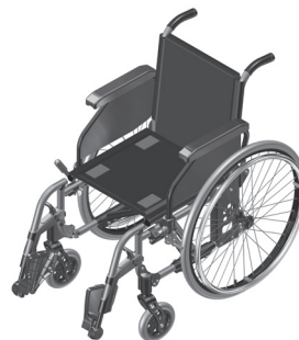
Figura 10.1- Retirada da almofada e rebatimento dos apoios para os pés.

A certificação desta cadeira de rodas não garante a segurança do usuário, caso a mesma tiver alterada a sua configuração original.